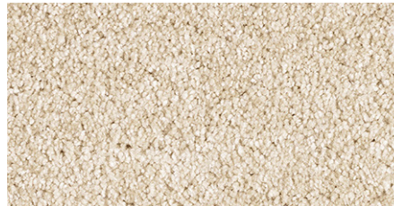
39 4m + 5m