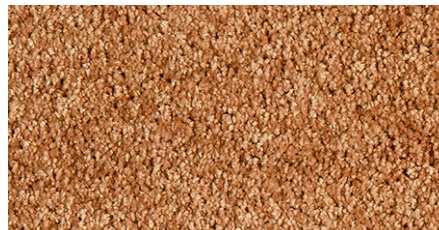
84 4m + 5m