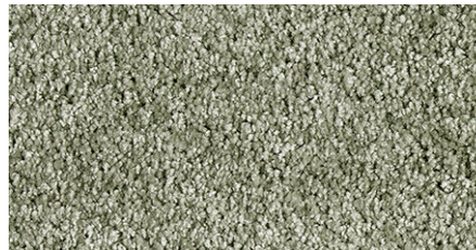
29 4m + 5m