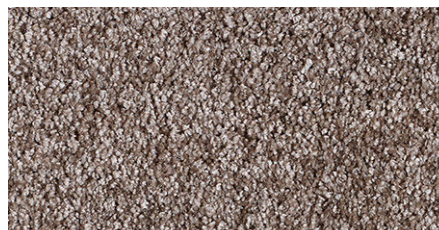
49 4m + 5m