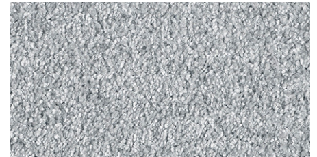
97 4m + 5m