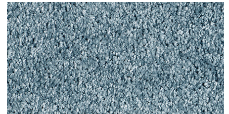
79 4m + 5m