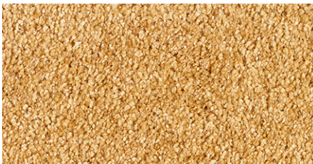
54 4m + 5m