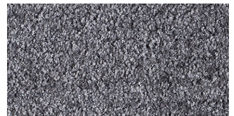
98 4m + 5m

La société Associated Weavers se réserve le droit de modifier les caractéristiques de ce produit tout en conservant les mêmes qualités techniques. Il est fortement conseillé d'utiliser les coloris moyens et foncés pour les pièces à grand trafic.