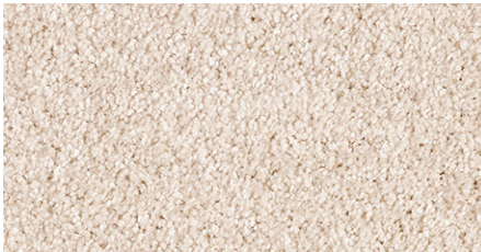
38 4m + 5m