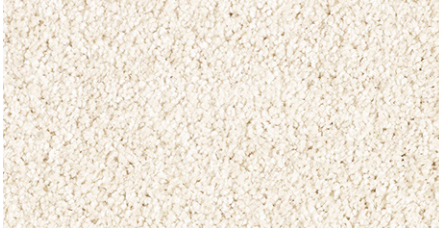
30 4m + 5m