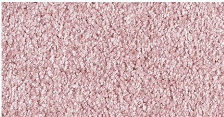
60 4m + 5m