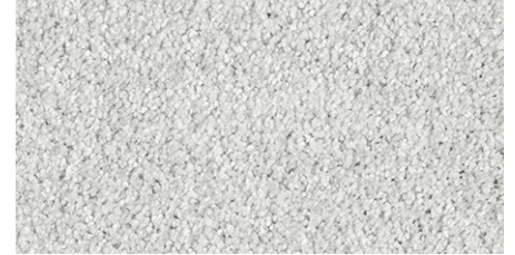
90 4m + 5m